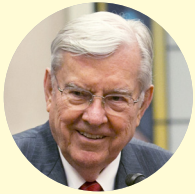
M. Russell Ballard du Collège des douze apôtres