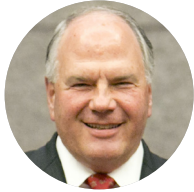
Ni Elder Ronald A. Rasband

Sa Korum sa Napulog Duha ka mga Apostoles