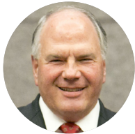
Fai 'e 'Eletā Ronald A. Rasband 'O e Kōlomu 'o e Kau 'Aposetolo 'e Toko Hongofulu Mā Uā