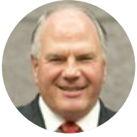
로널드 에이 래스밴드 장로 십이사도 정원회