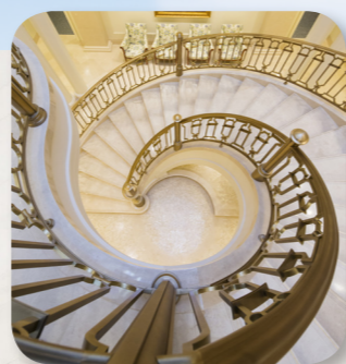
Спираловидно стълбище в храма Париж Франция

Казвам се Рейчъл. Живея близо до храма Париж Франция.