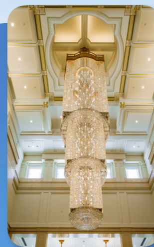
Полилеят в селестиалната стая на храма Сапоро Япония