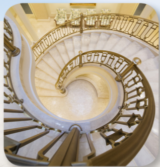
Հոգևոր աստիճանները Փարիզ Ֆրանսիա տաճարում: