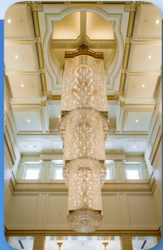
ចង្កៀងចងព្រួញពិដាន នៅក្នុងបន្ទប់ស ខ្សែស្ពាននៃព្រះវិហារបរិសុទ្ធ សាបប៊ូរី ប្រទេសជប៉ុន