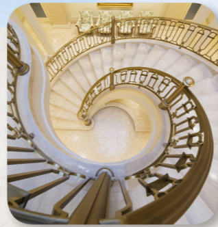
Točité schodiště v chrámu Paříž ve Francii