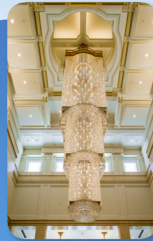
Lustr v celestiální místnosti chrámu Sapporo v Japonsku