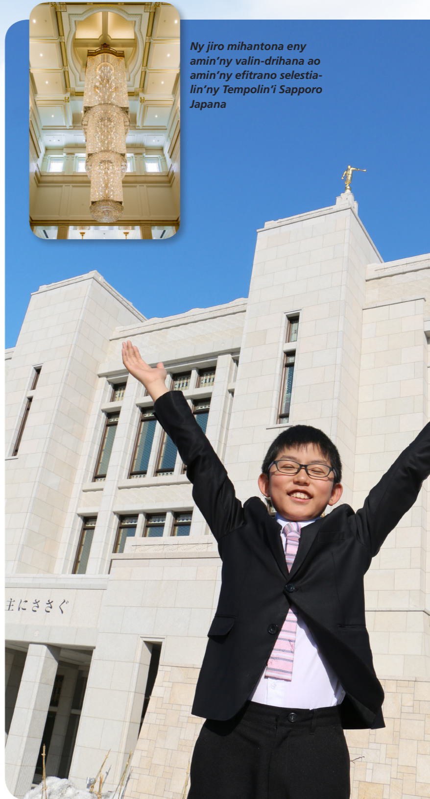
Ny jiro mihantona eny amin'ny valin-drihana ao amin'ny efitrano selestialin'ny Tempolin'i Sapporo Japana