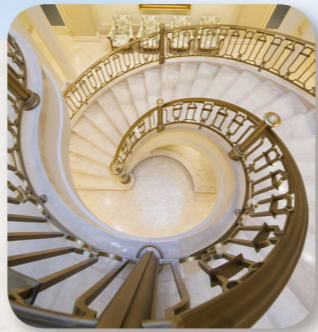
Na kabakaba wirini ena Valetabu e Paris Varanise