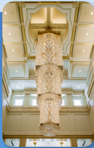
Na chadelier ena rumu vakasesitieli ena Valetabu mai Sapporo Japani