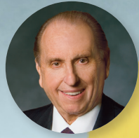
Präsident Thomas S. Monson