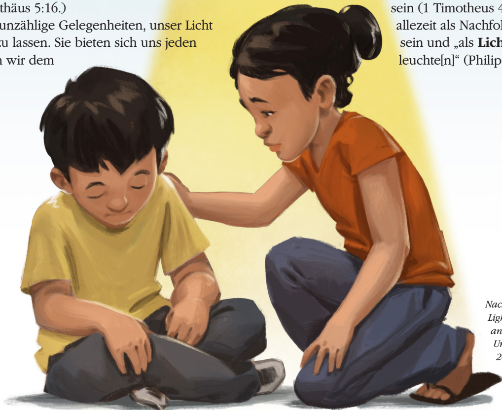
Nach der Ansprache „Be a Light to the World“, Andacht an der Brigham-Young-Universität am 1. November 2011, speeches.byu.edu

Meine Freunde, wir können, wie der Apostel Paulus es ausdrückt, „den Gläubigen ein Vorbild“ sein (1 Timotheus 4:12). Wir können allezeit als Nachfolger Christi bekannt sein und „als Lichter in der Welt leuchte[n]“ (Philipper 2:15). ■