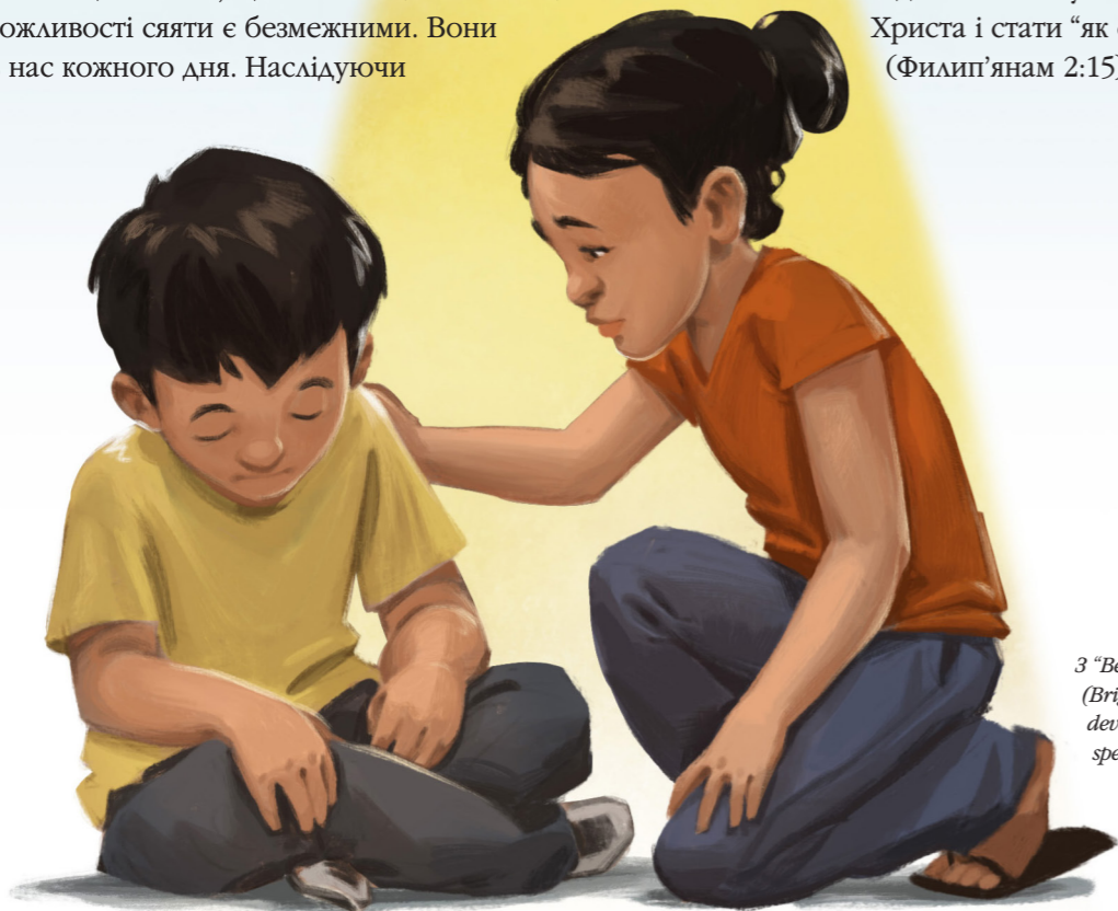
З “Be a Light to the World” (Brigham Young University devotional, Nov. 1, 2011), speeches.byu.edu.

Мої друзі, ми можемо бути, за словами апостола Павла, “зразком для вірних” (1 Тимофію 4:12). Ми завжди можемо бути послідовниками Христа і стати “як світла в світі” (Філіп'янам 2:15). ■