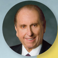
Президент Томас С. Монсон