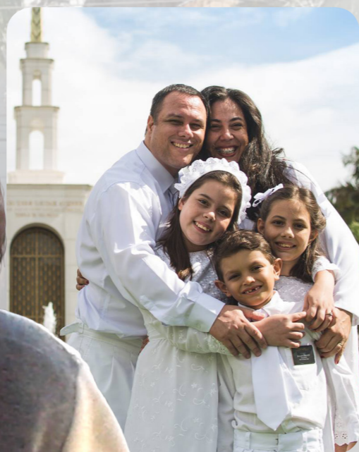
UNA FAMILIA FRENTE AL TEMPLO DE SÃO PAULO, BRASIL