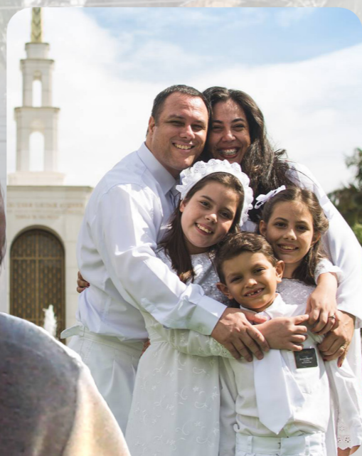
FAMÍLIA DIANTE DO TEMPLO DE SÃO PAULO BRASIL