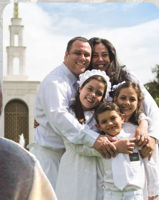
FAMILIEN STÅR FORAN TEMPLET I SÃO PAULO I BRASILIEN