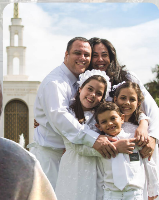
EN FAMILJ FRAMFÖR SÃO PAULO TEMPELI, BRASILIEN