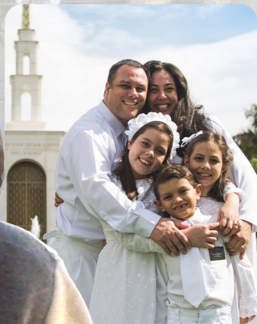
СМІЯ СТОП'Я НА ФОНІ ХРАМУ В САН-ПАУЛУ, БРАЗИЛІЯ