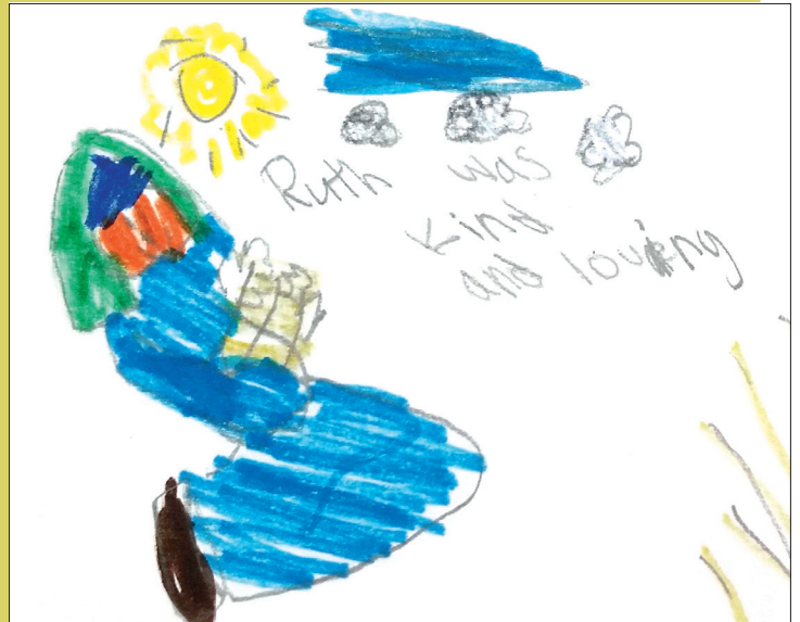
"Na'e angalelei mo 'ofa 'a Lute," fai 'e Kylee Q., ta'u 8, Veisinia, USA