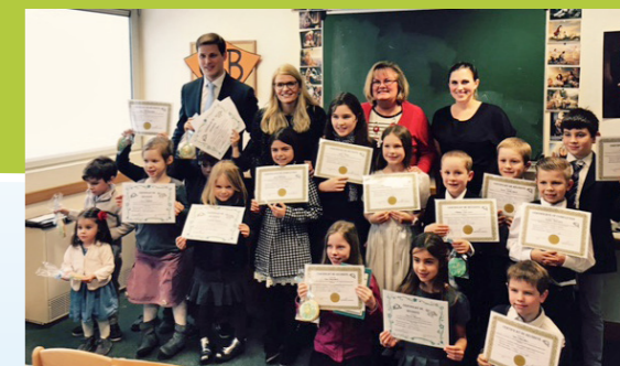
On a demandé aux enfants de la Primaire de cette paroisse d'Île de France de lire le Livre de Mormon chaque jour. Quand ils ont atteint leur but, ils ont reçu un diplôme !