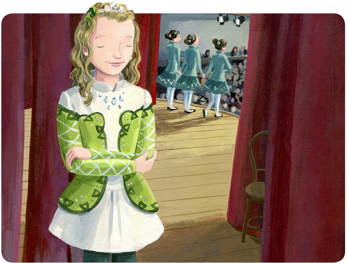
ILLUSTRATION MERCE TOUS