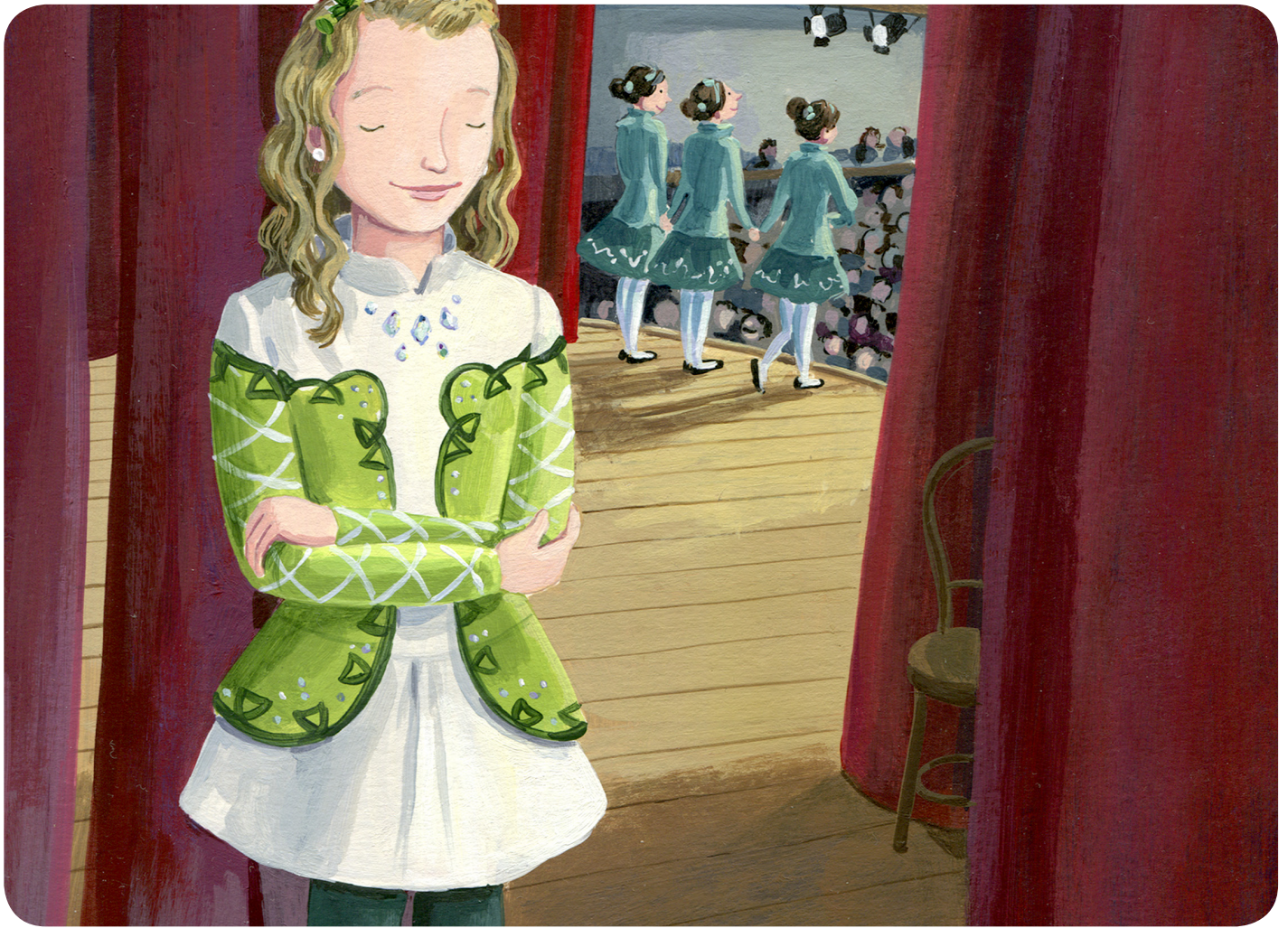
ภาพประกอบโดยแมทธิว นูซ