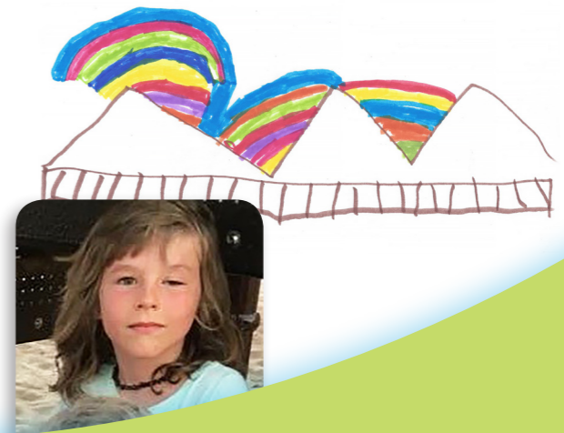
Jakub B., 10 tuổi

Một lần nọ em làm mất chiếc găng tay yêu thích của em. Em rất buồn. Mẹ và em đã cầu nguyện, nhưng không tìm được nó. Em cố gắng có đức tin. Một tuần sau đó, đứa em bé bỏng của em tìm thấy chiếc găng tay trên đường! Thượng Đế đáp ứng những lời cầu nguyện của chúng ta. Em yêu mến Ngài, và em biết rằng Ngài hằng sống.