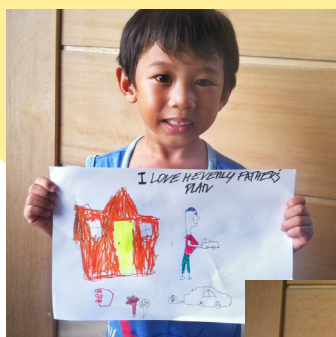
"Jag älskar min himmelske Faders plan", av Irreantum D. och "Jag vill dela med mig av evangeliet till alla", av Verlann T., Luzon, Filippinerna