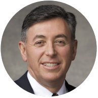
ដោយអែលអឺរ អាងឌីលសុន ឌី ប៉េឡា ផាវីលឡា ក្នុងពួកចិតសិបនាក់