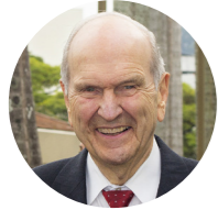
Iroun Beretitenti Russell M. Nelson