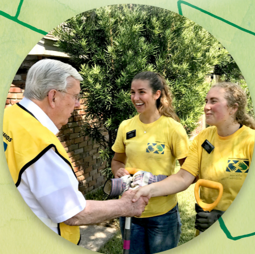
ATAPIUE MA LE CHURCH NEWS ATA NA TUSIA E ADAMI KOFORD

Sa feiloai o ia i faifeautalai ma isi tagata o le Ekalesia o e sa fesoasoani atu.