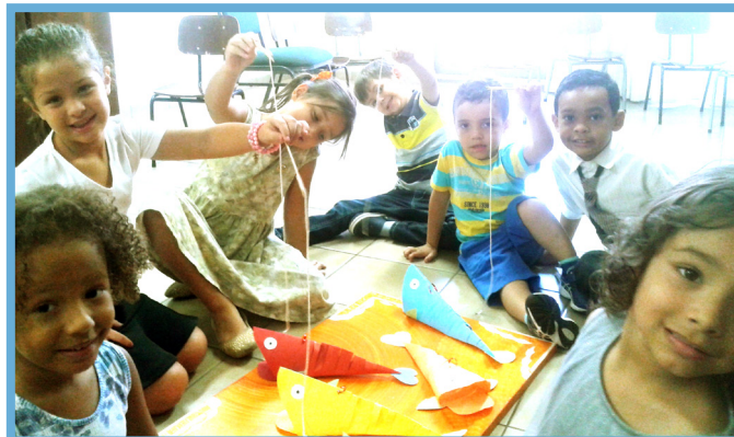
En VDR-3-klasse i São Paulo i Brasil lærte om dåpspakter ved å finne budskap, sitater og skrift- steder i fiskenes munn.