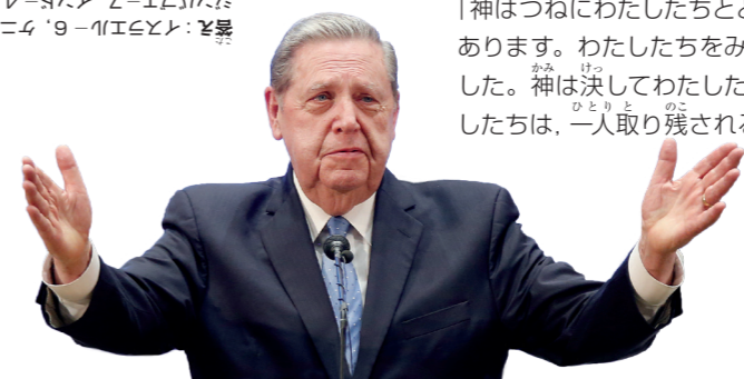
ホランド長老の手記「ジェフリー・R・ホランド長老の手記」

「神はつねにわたしたちとともにいてくださるというあかしがあります。わたしたちをみちびいてくれる預言者を下さいました。神は決してわたしたちをお見捨てになりません。わたしたちは、一人取り残されることはありません。」