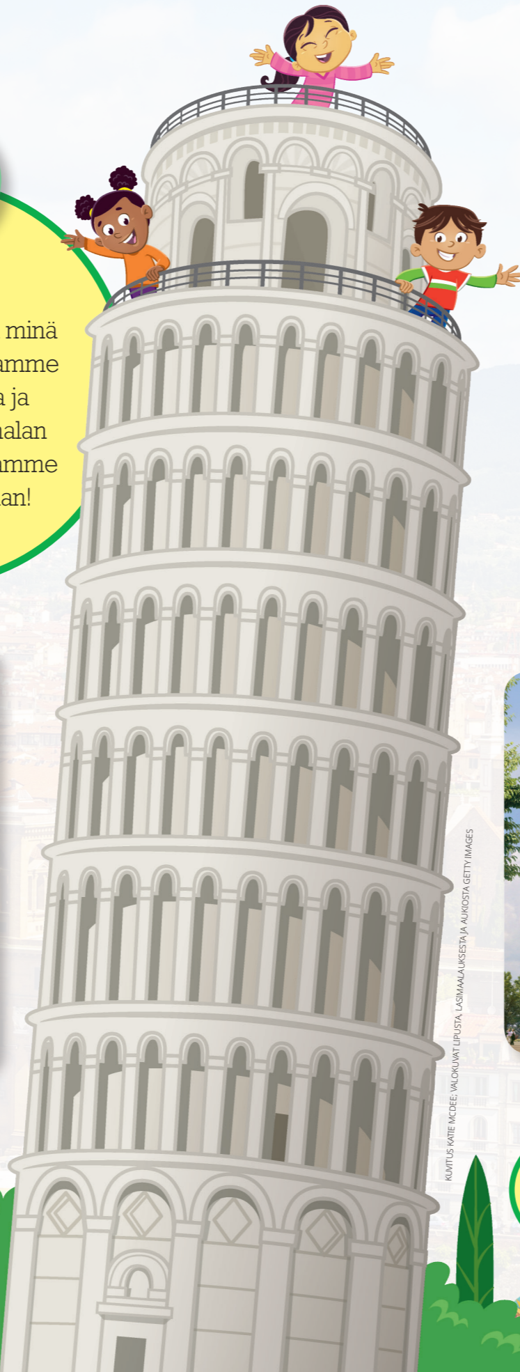
KUUVITUS: KATIE MCQUEE; VALOKUUVAT: LIPUSTA, LASIMAAJAKSESTIA, AUKIOSTA, GETTY IMAGES

Useimmat italialaiset kuuluvat roomalaiskatoliseen kirkkoon. Vaikka osa heidän uskonkäsityksistään onkin erilaisia kuin meidän, he uskovat taivaalliseen Isään, Jeesukseen Kristukseen ja Pyhään Henkeen.