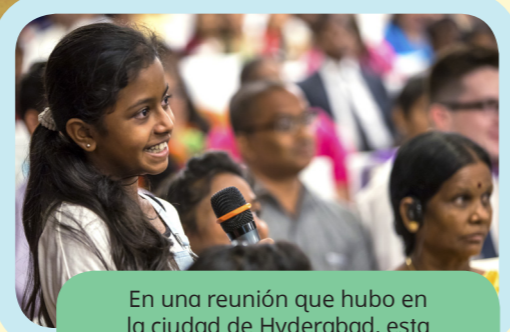
En una reunión que hubo en la ciudad de Hyderabad, esta niña le hizo una pregunta al élder Bednar.

“Cuanto más viajo por el mundo, más países visito y de cuanta más gente tengo la bendición de aprender, más me doy cuenta de que en todo el mundo las personas son básicamente iguales”.