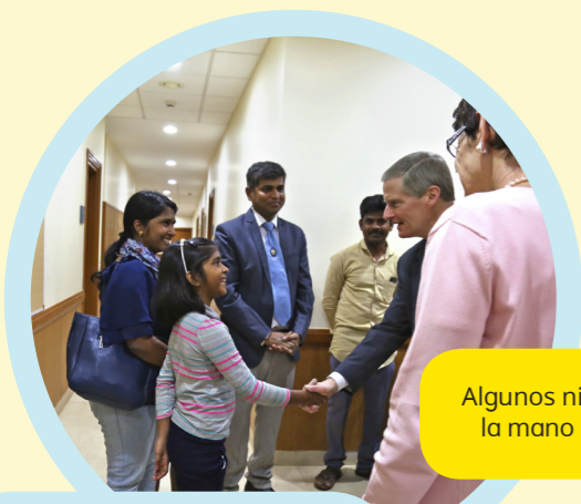
Algunos niños pudieron dar la mano al élder Bednar.