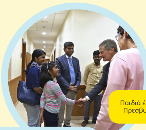
Παιδιά έσφιξαν το χέρι του Πρεσβυτέρου Μπέντναρ.