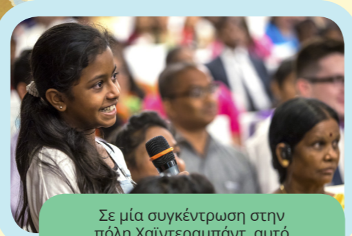
Σε μία συγκέντρωση στην πόλη Χαίντεραμπάντ, αυτό το κορίτσι έκανε μια ερώτηση στον Πρεσβύτερο Μπέντναρ.