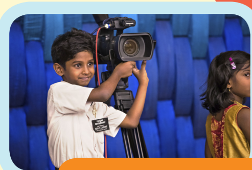
Ikviens priecājās par iespēju dzirdēt Dieva apustuļa liecību!

„Jo vairāk es apceļoju pasauli, jo vairāk valstu es apmeklēju, tiekot svētīts ar iespēju mācīties no satiktajiem cilvēkiem, jo vairāk es saprotu, ka visā pasaulē visi cilvēki pašos pamatos ir līdzīgi.”