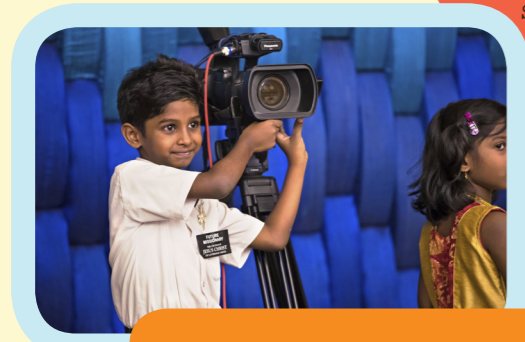
Tutti sono stati felici di ascoltare la testimonianza di un apostolo di Dio!