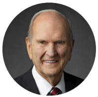
Președintele Russell M. Nelson