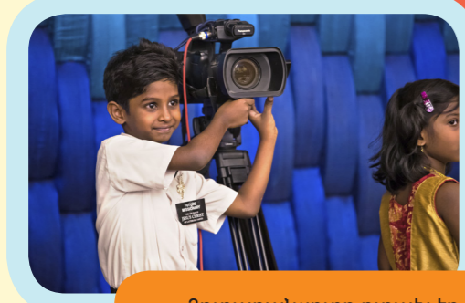
Յուրաքանչյուրը ուրախ էր լսելու Աստծո Առաքյալի վկայությունը: