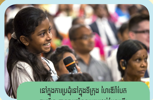
នៅក្នុងការប្រជុំនៅក្នុងទីក្រុង ហៃឌើរីហែត កុមារីនេះបានសួរសំណួរមួយដល់រំលែងខ្លឹម បែដណា ។