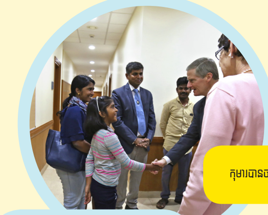
កុមារបានចាប់ដៃរំលែងខ្លឹមបែដណា ។