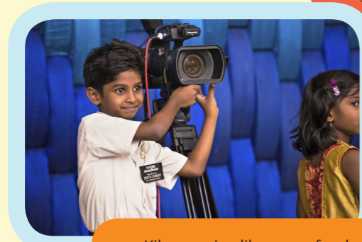
Kila mmoja alikuwa na furaha kusikia ushuhuda wa mtume wa Mungu!

"Kadiri kwa wingi ninavyosafiri ulimwenguni, ndivyo ninavyozuru mataifa mengi, ndivyo ninavyopata watu wengi zaidi ninaobarikiwa kujifunza kutoka kwao, ndivyo zaidi ninavyokuta kwamba ulimwenguni kote watu ni kama wanafanana."