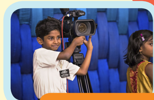
!Evriwan i bin hapi blong harem testimoni blong wan Aposol blong God!

"Moa mi travel raon long wol, moa nesen mi stap visitim, moa pipol mi gat blesing ia blong lanem abaot olgeta, moa mi faenem se, long ful wol, plante taem ol pipol oli semmak nomo."