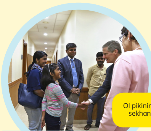
Ol pikinini oli gat janis blong sekhan long Elda Bedna.