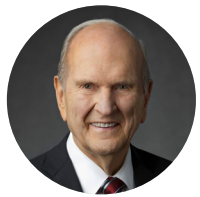
Jān Būreejtōn Russell M. Nelson