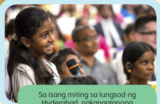
Sa isang miting sa lungsod ng Hyderabad, nakapagitanong ang batang babaeng ito kay Elder Bednar.