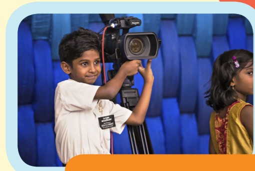
Masaya ang lahat na marinig ang patotoo ng isang Apostol ng Diyos!

"Sa dumaraming bilang ng aking paglalakbay sa mundo, sa pagdami ng bansang nabibisita ko, mas maraming tao ang nagpapala sa aking buhay, at mas nalalaman ko na ang lahat ng tao sa mundo, sa pangkalahatan, ay magkakapareho."