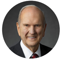
Nā te peresideni Russell M. Nelson