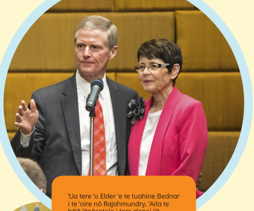
'Ua tere 'o Elder 'e te tuahine Bednar i te 'oire nō Rajahmundry. 'Aita te hō'ē 'āpōsetolo i tere d'enei i'ō.

'Ua tere atu 'o Elder David A. Bednar rāua tāna vahine 'o Susan Bednar, nō te fa'a'ite i tōna 'itera'a pāpū nō Iesu Mesia i te mau melo o te 'Ēkālesia i te fenua Inidia. 'O Inidia hō'ē o te mau fenua rahi roa a'e o te ao nei. 'Aita e maoro roa, e patuhia tō reira hiero mātāmua !