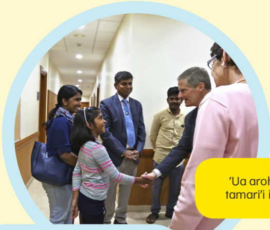
'Ua aroha rima te mau tamari'i ia Elder Bednar.