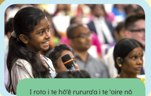
I roto i te hō'ē rururā'a i te 'oire nō Hyderabad, 'ua ui teie tamāhine i te hō'ē uirā'a ia Elder Bednar.