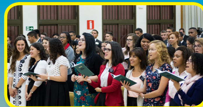
Ældste og søster Cook besøgte en missionærskole. Missionærerne deler Jesu Kristi lys hver dag!