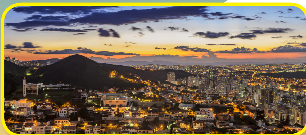
De besøgte den store by Belo Horizonte. Byens navn betyder »smukke horisont«. Ældste Cook sagde, at der var de smukkeste solnedgange, han nogensinde havde set.