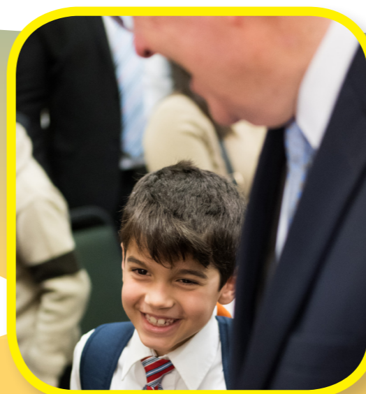
Børnene blev meget glade for at møde en af Guds apostle!

Når vi er et lys, kan vi påvirke verden i bedre retning.