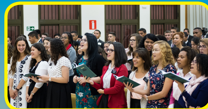
Ouderling en zuster Cook bezochten ook een opleidingscentrum voor zendelingen. Zendelingen brengen elke dag het licht van Jezus Christus naar de mensen!