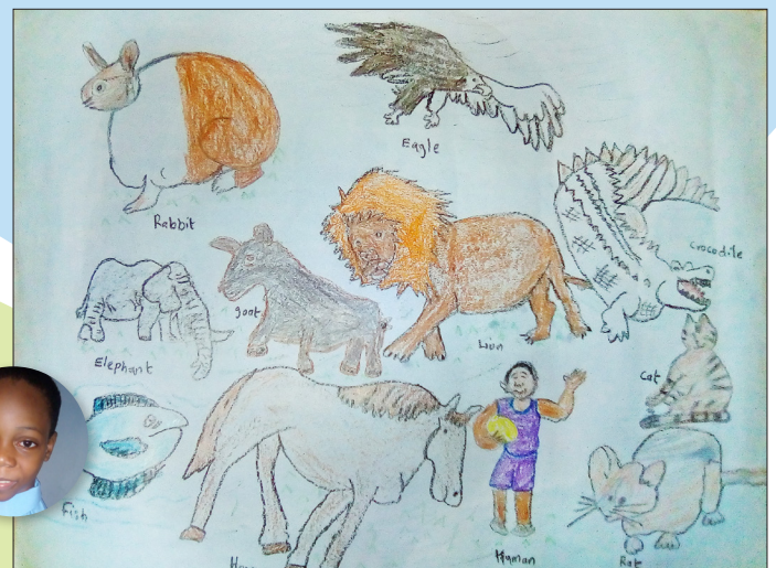
Feranmi F. (8), Lagos (Nigeria)