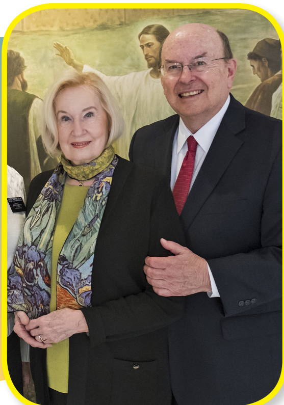
Quentin L. Cook et Mary Cook sont allés au Brésil pour rendre visite aux membres de l'Église. Ils y ont enseigné et communiqué l'amour de Jésus-Christ.