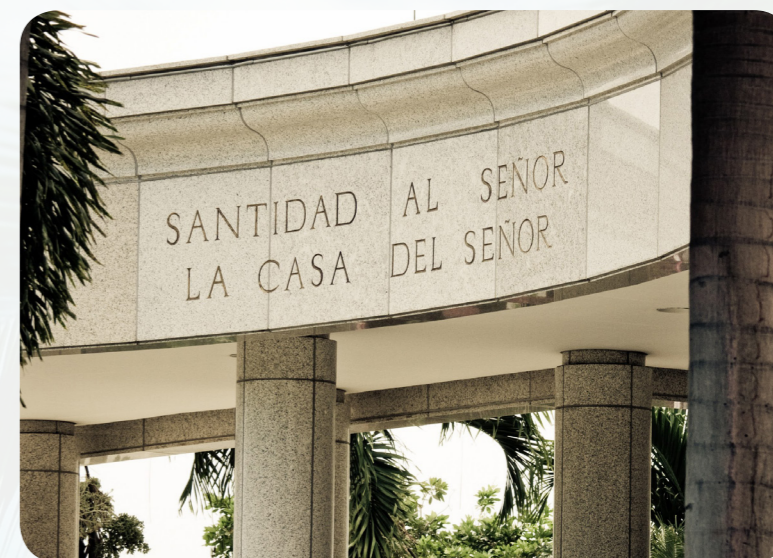
In der Dominikanischen Republik gibt es einen Tempel, und zwar in Santo Domingo. Darauf steht: „Santidad al Señor: La Casa del Señor“. Das bedeutet: „Heilig dem Herrn – das Haus des Herrn“.