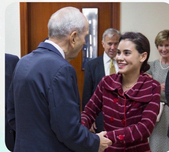
Letztes Jahr besuchte der Prophet die Dominikanische Republik und sprach mit den Menschen auf Spanisch.