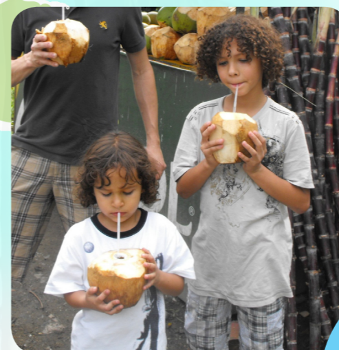
Люди в Доминиканской Республике едят много тропических овощей и фруктов. Эти мальчики пьют из кокосовых орехов!

А вы из Доминиканской Республики? Напишите нам! Мы бы хотели получить от вас весточку!