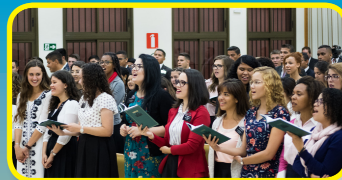
Старійшина і сестра Кук відвідали Центр підготовки місіонерів. Місіонери діляться світлом Ісуса Христа кожного дня!