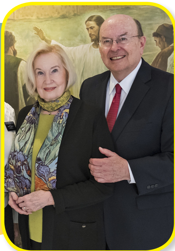
Старійшина Квентін Л. Кук і сестра Мері Кук їздили до Бразилії, щоб відвідати членів Церкви. Вони поїхали, щоб навчати і ділитися любов'ю Ісуса Христа.