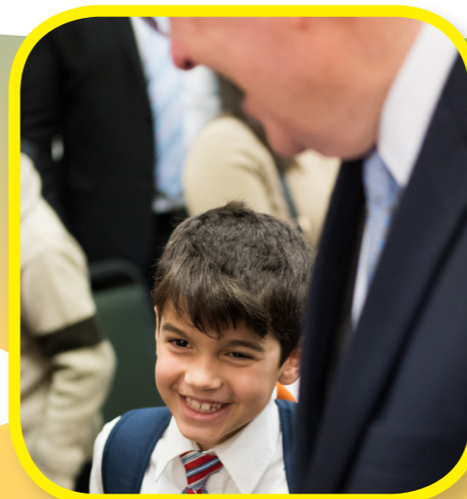
Діти були дуже раді зустрічі з апостолом Бога!