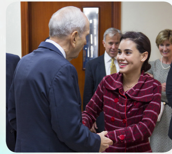
Минулого року пророк відвідав Домініканську Республіку і звертався до людей іспанською мовою.