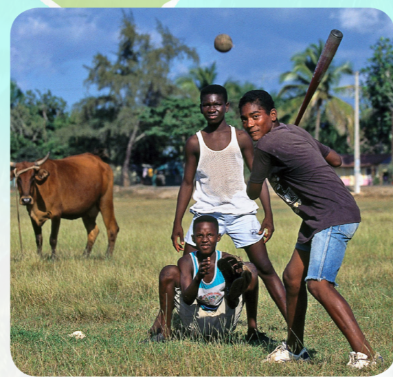
Багато дітей в Домініканській Республіці любить грати в бейсбол. Це найпопулярніший спорт у країні.

У Домініканській Республіці розмовляють іспанською. Ось хлопчик тримає Libro de Mormón—Книгу Мормона.