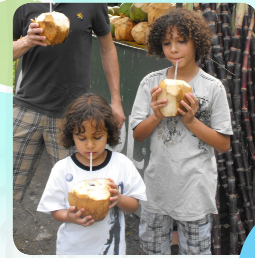
Люди в Домініканській Республіці їдять багато тропічних овочів та фруктів. Ці хлопчики п'ють з кокосових горіхів!

А ви з Домініканської Республіки? Пишіть нам! Ми будемо раді отримати вашого листа!