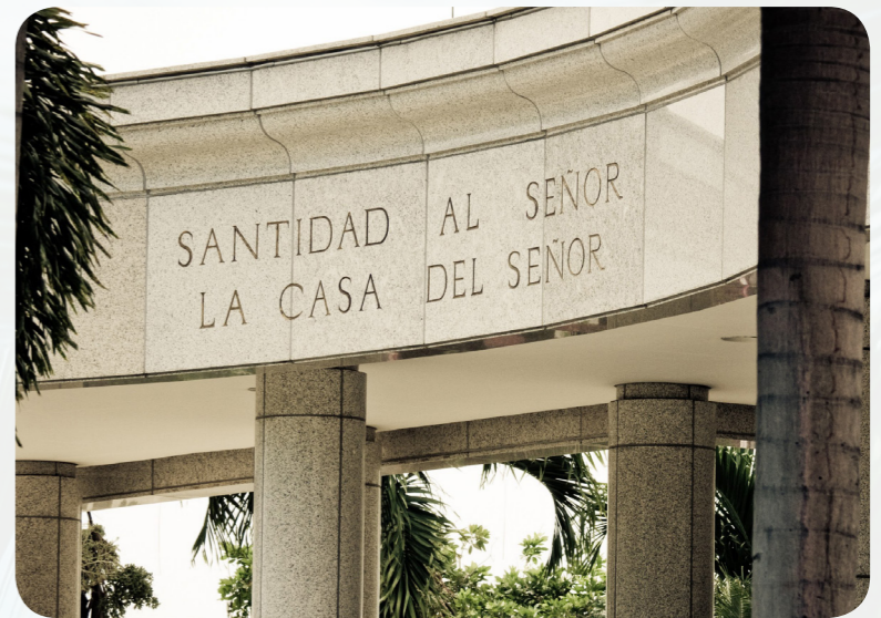
У Домініканській Республіці є один храм у Санто-Домінго. Напис містить слова: "Santidad al Señor: La Casa del Señor". Це означає: "Святиня для Господа. Дім Господа".